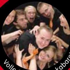
Volle Möhre Improkabarett