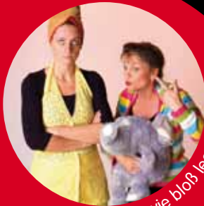
Weiter nix wie bloß leern!